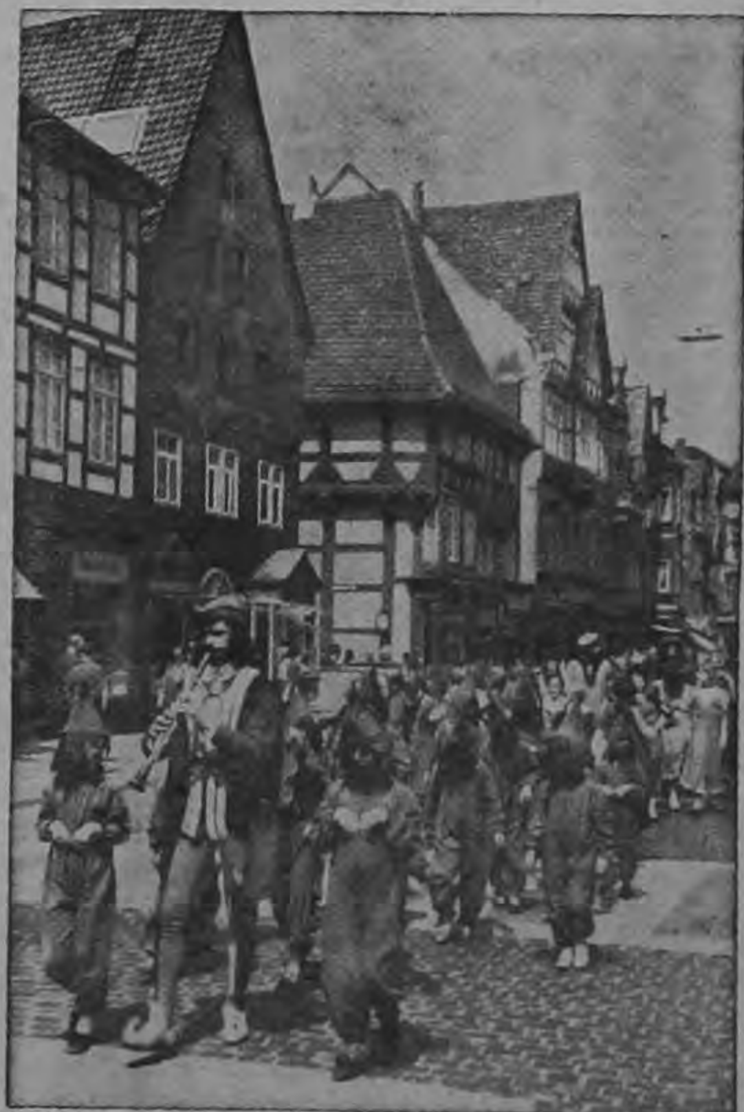
TOCANDO LA FLAUTA SE LLEVA TRAS SI un cazador de ratas cada domingo a un gran tropel de chicos por calles y callejones de la pequeña ciudad de Hamelin (República Federal de Alemania). Muchachos y muchachas —algunos de ellos disfrazados de ratas— desfilan entre las filas de los espectadores en dirección a la puerta de la ciudad. Estos desfiles históricos en atuendos de fantasía tienen lugar hasta el mes de septiembre e ilustran una antigua leyenda popular alemana, originada en el siglo XIII. Según un antiguo manuscrito, un flautista raptó en 1284 con su flauta mágica a 130 niños de Hamelin. Al igual que el Dr. Fausto, que pactó con el diablo, y el travieso bromista Till Eulenspiegel, en esta figura de leyenda del cazador de ratas de Hamelin se entretiene también la fantasía y la verdad. La fantasía popular ha probablemente enlazado un hecho histórico, la partida de muchachos y muchachas de Hamelin para colonizar la Bohemia (actualmente Checoslovaquia), con los éxitos de un cazador de ratas que limpió de roedores a muchas localidades de esta comarca. Parece que la ciudad de Hamelin le dejó a deber su salario. Por venganza, el cazador de ratas se llevó tras sí a los niños fuera de la ciudad y los abandonó para siempre en una montaña. Esta vieja saga ha inspirado al poeta alemán Johann Wolfgang Goethe su "Canción del cazador de ratas", a la que incluso puso música Hugo von Wolf.

El señor Presidente de la República estuvo en todo momento, preocupado por conocer datos y forma de operar de las Empacadoras, mostrándose al final, satisfecho con las impresiones recogidas en esta visita.