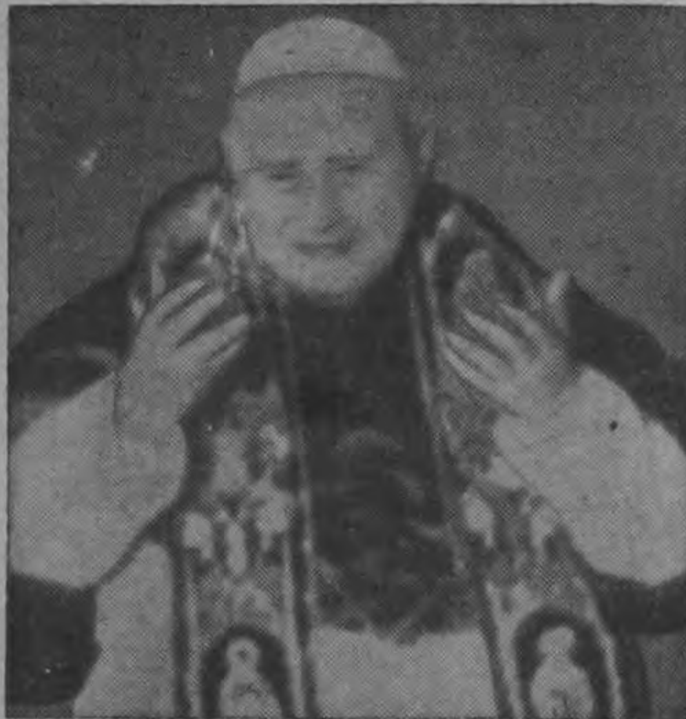
SU SANTIDAD EL PAPA JUAN XXIII

Luego, habló claramente con sus hermanos, sobre temas del amor a Cristo, el sacrificio y la Iglesia. Bendijo a los presentes, y pidió que le fueran leídos pasajes de la Biblia.