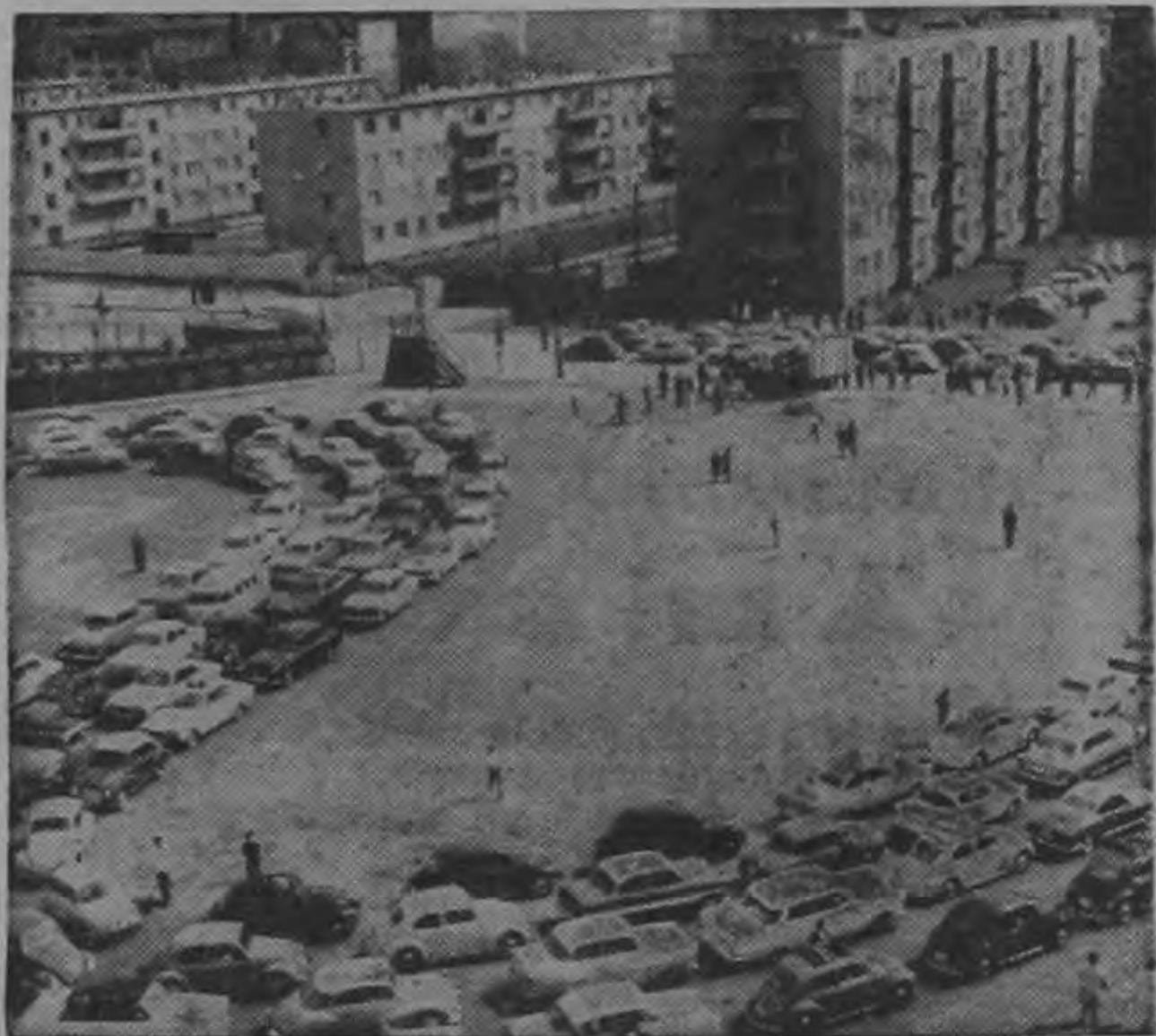
En el paso entre los sectores para los alemanes occidentales en la Prinzenstrasse la columna de autos avanzaba lentamente. Pero los automovilistas esperaban pacientemente que se les despachase. En su firme propósito de volver a ver en el Berlín. Este a sus familias y amigos no les importaba esperar las horas que fuese necesario porque saben la nostalgia con que allí se les espera.

Felicitemos cordialmente a McCann Erickson Centroamericana y a sus cuatro importantes clientes que han realizado el enorme esfuerzo de presentar por Canal 7 a partir de hoy y todos los domingos de las 9 a las 10 de la noche, una serie de TV de absoluta calidad y grandes méritos: LOS DEFENSORES.